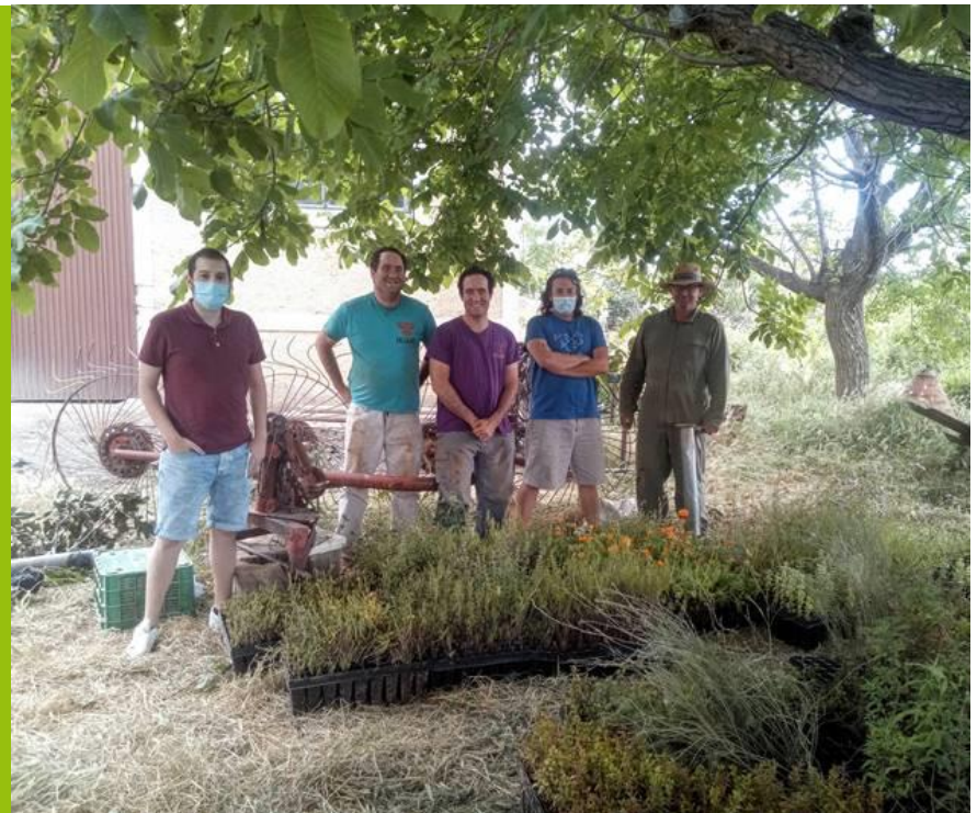
Personal de la explotación "El Medio Celemín" y ANSE